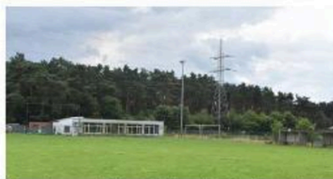
Volgens burgemeester Caeyers is het noodzakelijk om te investeren in sportsite Donk.

Personeel (-1,9 miljoen): 30 voltijdse jobs (VTE) worden niet vervangen bij pensionering of vertrek. Caeyers garandeert dat er geen naakte ontslagen vallen en dat de dienstverlening niet zal lijden. "De afbouw verloopt de komende zes jaar gespreid over meer dan twintig afdelingen, zonder impact op wachttijden of basisdienstverlening."