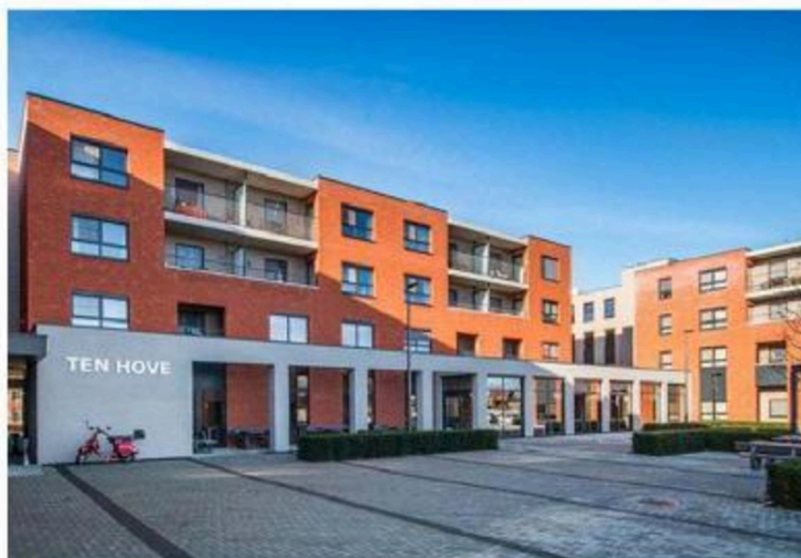
De bewoners van woonzorgcentrum Ten Hove zullen binnenkort meer moeten betalen.

Om de begroting sluitend te krijgen grijpt het bestuur in: 3,1 miljoen besparen en 1,7 miljoen extra inkomsten genereren. "Ongeveer twee derde van de financiële uitdaging lossen we op door mindere uitgaven en eenderde door gerichte stijging van inkomsten", benadrukt burgemeester Caeyers. "Een belastingverhoging zou de gemakkelijkste keuze geweest zijn. Wij hebben samen met het managementteam en onze afdelingshoofden grondig naar ontvangsten en uitgaven gekeken. Dat is correct bestuur, zonder alles op de burger af te wentelen."